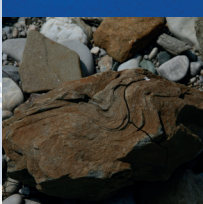
Alexander von Humboldt